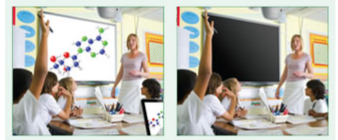
Eco AV Mute Funktion aus 100% Stromverbrauch

Behalten Sie während Ihrer Präsentation mit der ECO-AV-Mute-Funktion die Kontrolle. Richten Sie die Aufmerksamkeit Ihres Publikums durch Ausblenden weg von der Leinwand, wenn das Bild nicht benötigt wird. Dies reduziert den Stromverbrauch unmittelbar um 30%, und verlängert darüber hinaus die Lebensdauer Ihrer Lampe.